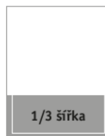
Formát na spad 210 x 90 mm Formát na zrcadlo 190 x 76 mm