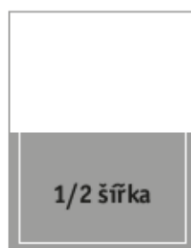
Formát na spad 210 x 136 mm Formát na zrcadlo 190 x 116 mm