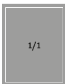
Formát na spad 210 x 275 mm Formát na zrcadlo 190 x 240 mm