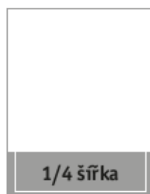
Formát na spad 210 x 65 mm Formát na zrcadlo 190 x 55 mm