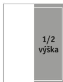
Formát na spad 103 x 275 mm Formát na zrcadlo 93 x 240 mm