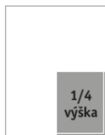
Formát na spad 103 x 136 mm Formát na zrcadlo 93 x 116 mm